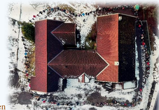
Bildet viser lokalsamfunnet som sammen står i ring rundt barnehagen

Til syvende og sist er det kanskje den kjærligheten og lidenskapen som hver ansatt bringer med seg hver dag som gjør at Eidsfoss Barnehage virkelig skiller seg ut. Det er dette som gjør at både barn og foreldre føler seg velkomne, og som gjør at barnehagen blir omtalt som "den lille barnehagen med det store hjertet".