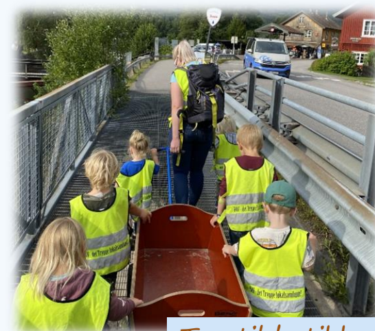
Tur til butikken for å handle

I tillegg bruker vi et overgangsskjema som fylles ut i samarbeid med foreldrene til førskolebarna. Dette skjemaet sendes til skolen med foreldrenes samtykke. Videre deltar barnehagen i flere dialogmøter med skolen før skolestart for å sikre en god overgang. På denne måten jobber vi for at barna skal være godt forberedt, både faglig og sosialt, til den nye hverdagen som skolebarn.